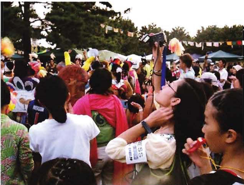
金沢文庫芸術祭 1DAY イベントの生中継