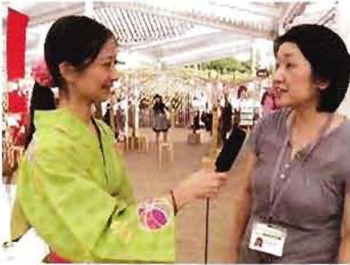
ヒルサイドでの取材風景