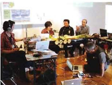
環境行動フォーラムで多元生中継