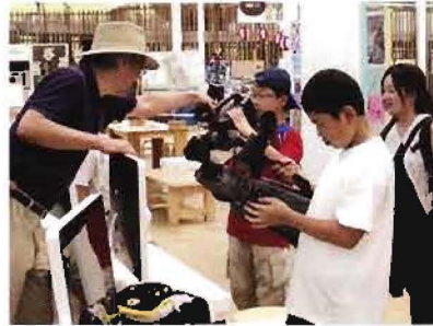
ヒルサイドでワークショップ