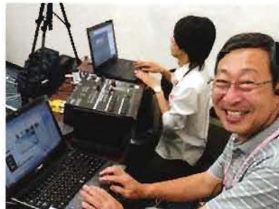
横浜市事業評価会議を生中継