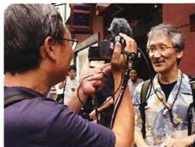
ザ・コヴ上映初日劇場前から生中継