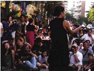
吉田町の JAZZ STREET と大道芸を生中継